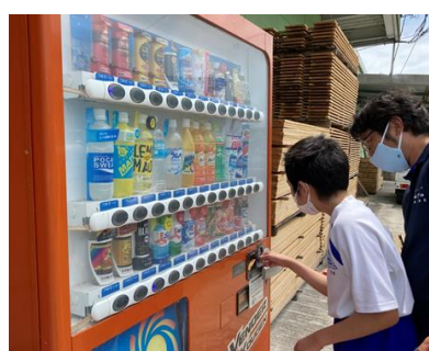
校外の自動販売機へ