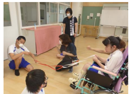
余暇活動（ひっぱり相撲）