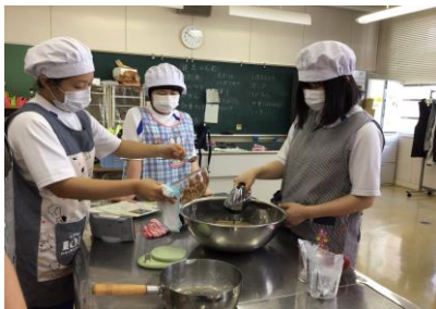
マドレーヌ生地作り