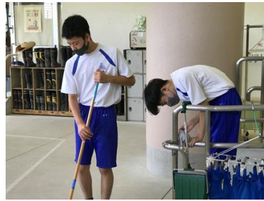
コモンホール清掃