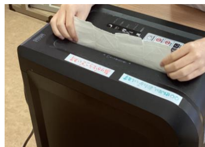
シュレッダー作業