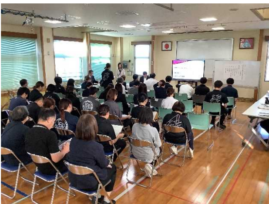
知的障がい教育部門小学部分科会