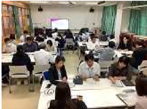
知的障がい教育部門高等部分科会

40名を超える先生方にご参加いただきました。分科会では、熱心な話し合いがなされ、活発な意見交換が行われていました。ご参加くださいました皆様、ありがとうございました。