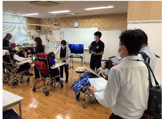
肢体不自由教育部門中学部（美術科）